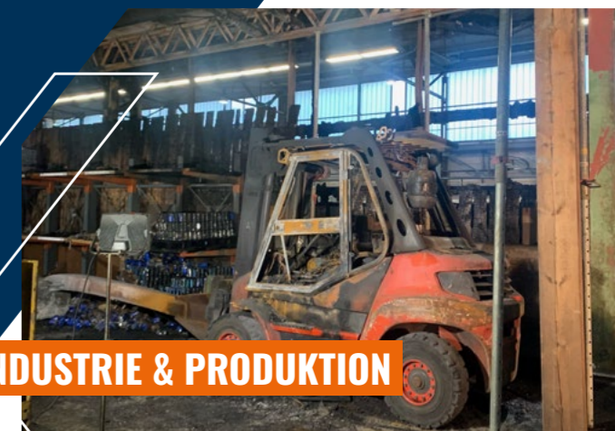
INDUSTRIE & PRODUKTION

in der Industrie oder laufender Betrieb in angrenzenden Gebäudeteilen – wir arbeiten in enger Abstimmung mit Ihren Fachabteilungen, um den Schaden maximal wirtschaftlich zu sanieren und den Ursprungszustand wiederherzustellen.