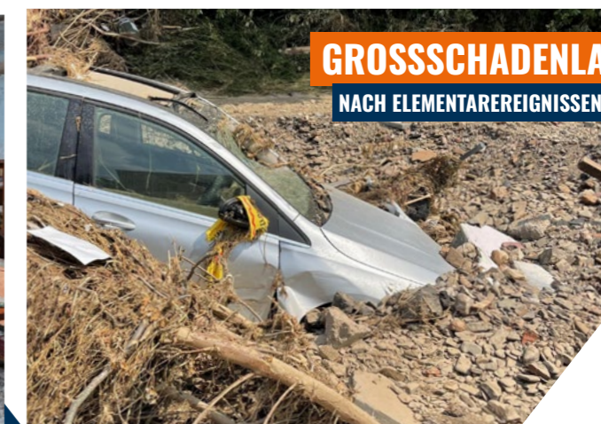
GROSSSCHADENLAGEN NACH ELEMENTAREREIGNISSEN