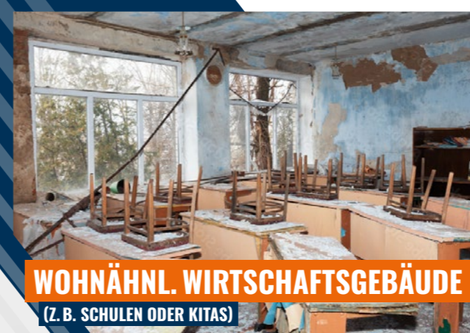
WOHNÄHNL. WIRTSCHAFTSGEBÄUDE (Z. B. SCHULEN ODER KITAS)