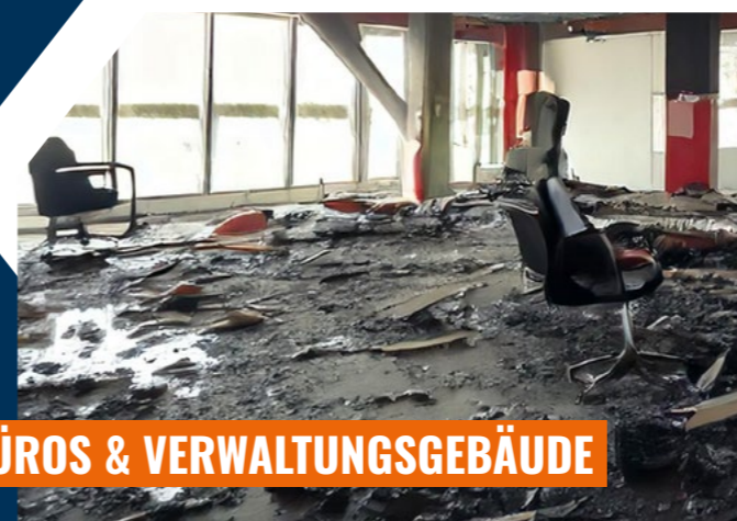
BÜROS & VERWALTUNGSGEBÄUDE