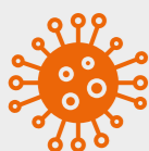
Gefahrgut- und Säureschäden