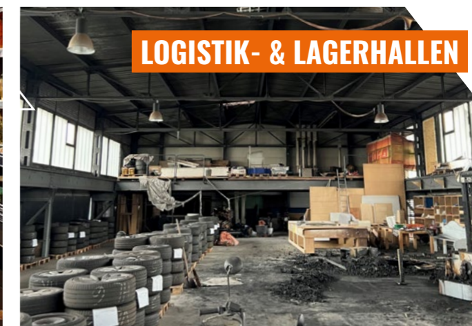
LOGISTIK- & LAGERHALLEN